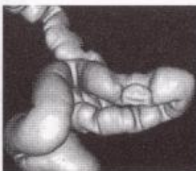
▲CTコロノグラフィによる映像

万が一、検査により大腸ポリープが発見された場合は、内視鏡により切除します。小さなポリープなら日帰り手術のみでOK、入院の必要はありません。